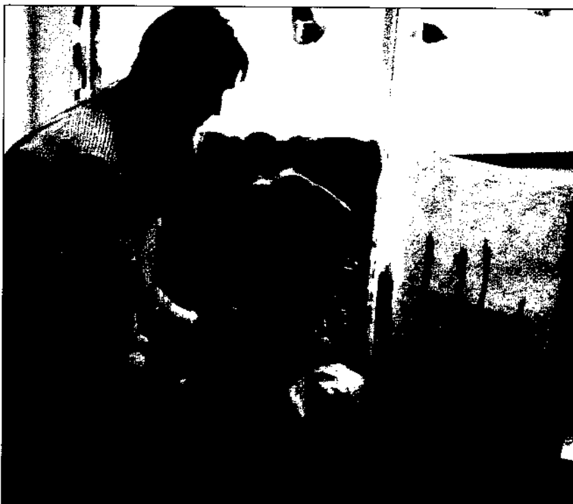
El ámbito más restringido en el que se da la relación enseñanza-aprendizaje son las aulas