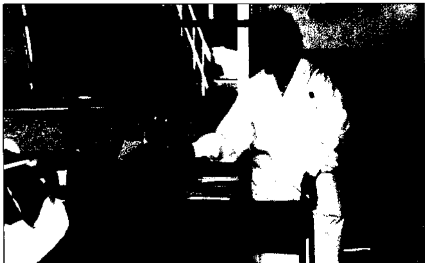
Calidad es la conformidad del producto con las necesidades expresadas por los clientes

Si aun en casos tan simples como la fabricación de productos materiales, en los que la satisfacción del cliente