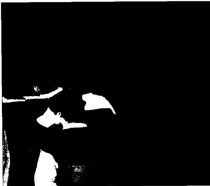
El concepto de "mejora de la escuela" apenas ha calado en nuestro sistema educativo

los factores que inciden en su calidad, generándose lo que Grace (1998) ha denominado "reduccionismo contextual"; o que sus resultados han sido utilizados de forma perversa por parte de los políticos (Rea y Weiner, 1997), especialmente en países en desarrollo (Pennycuik 1993). Aunque, siendo más realistas, en nuestro contexto gran parte de las críticas surgen por simple desconocimiento, prejuicios o, en ocasiones, por partir de visiones integristas de la educación y su mejora. Sea como fuere, y como afirma Fernando Hernández (1999), en la actualidad la noción de eficacia escolar es muy diferente de aquella sobre la que surgió dado que, por ejemplo, incorpora el concepto de equidad: "buscar que una escuela sea eficaz es como una línea en el horizonte, muy útil para encauzar el debate sobre lo que acontece en los centros de Secundaria y abrirlo en los de Primaria" (Hernández, 1999: 11).