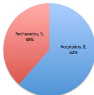
Gráfico 1. Total de aportaciones recibidas en REICE 12(3)

De los 13 manuscritos recibidos en el volumen 12, número 3 de REICE, se aceptaron ocho, lo que supone una tasa de rechazo del 38% en este número (gráfico 1).