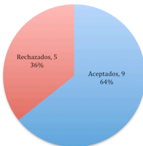
Gráfico 1. Total de aportaciones recibidas en REICE 12(5)

De los 14 manuscritos recibidos en el volumen 12, número 5 de REICE, se aceptaron nueve, lo que supone una tasa de rechazo del 35,7% en este número (gráfico 1).