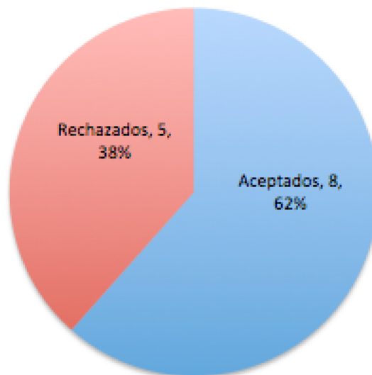
Gráfico 1. Total de aportaciones recibidas en REICE 13(2)

De los 13 manuscritos recibidos en el volumen 13, número 2 de REICE, se aceptaron ocho, lo que supone una tasa de rechazo del 38% en este número (gráfico 1).