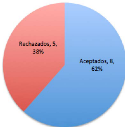
Gráfico 1. Total de aportaciones recibidas en REICE 13(3)

De los 13 manuscritos recibidos en el volumen 13, número 3 de REICE, se aceptaron ocho, lo que supone una tasa de rechazo del 38% en este número (gráfico 1).