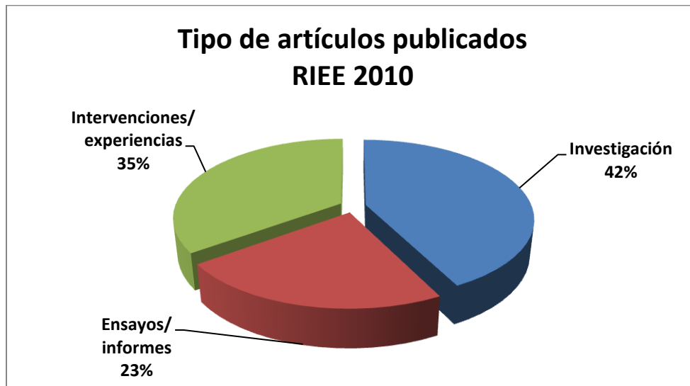
Gráfico 2 Distribución de los artículos publicados en RIEE según su tipo