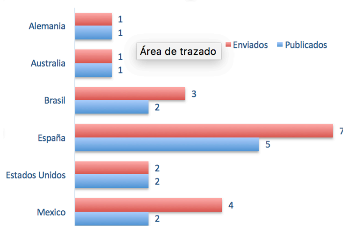
Gráfico 2. País de procedencia de los artículos recibidos en RIEJS 3(1)

De todos ellos, España es el país con mayor número de aportaciones, siete, de las cuales cinco resultaron finalmente publicadas. A continuación México que envía cuatro aportaciones de las que dos resultan publicables tras el proceso de evaluación. Por su parte, Brasil con tres aportaciones, de las cuales dos resultaron publicables. Estados Unidos envía dos trabajos que fueron publicables y Alemania y Australia enviaron una única aportación que resultó evaluada positivamente.