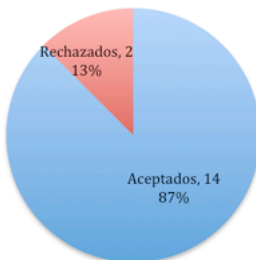
Gráfico 1. Total de aportaciones recibidas en RIEJS 3(2)

De los 14 manuscritos recibidos en el volumen 3, número 2 de RIEJS, se aceptaron 12, lo que supone una tasa de rechazo del 13% en este número (gráfico 1).