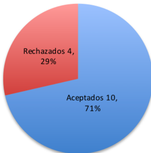
Gráfico 1. Total de aportaciones recibidas en Revista Internacional de Educación para la Justicia Social (RIEJS), 4(1)

De los 14 manuscritos recibidos en el volumen 4, número 1 de Revista Internacional de Educación para la Justicia Social (RIEJS), se aceptaron diez, lo que supone una tasa de rechazo del 29% en este número (gráfico 1).