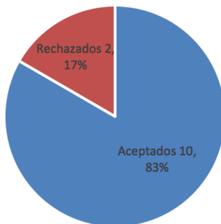
Gráfico 1. Total de aportaciones recibidas en Revista Internacional de Educación para la Justicia Social (RIEJS), 5(2)

De los 12 manuscritos recibidos en el volumen 5, número 2 de Revista Internacional de Educación para la Justicia Social (RIEJS), se aceptaron diez, lo que supone una tasa de rechazo del 17% en este número (gráfico 1).